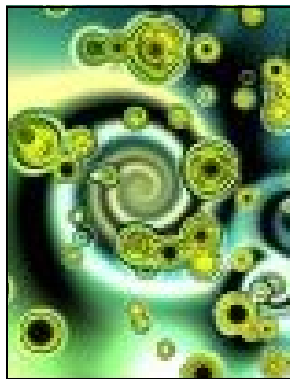
Imagen fractal alusiva a la presencia en Internet del Club Cebra

El Club Cebra viene a llenar un vacío detectado en las técnicas pedagógicas tradicionalmente empleadas con infantes en materia de seguridad vial.